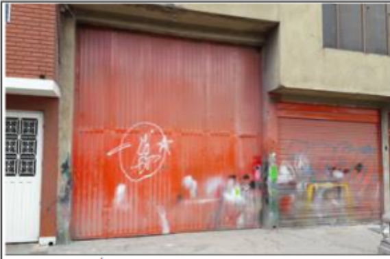
FOTOGRAFÍA 3. SOCIEDAD OPERANDO A PUERTA CERRADA