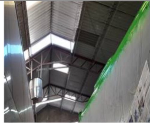
FOTOGRAFÍA 4. SISTEMA DE EXTACCION SOBRE LA BODEGA CON DUCTO Y BODEGA SIN CONFINAR