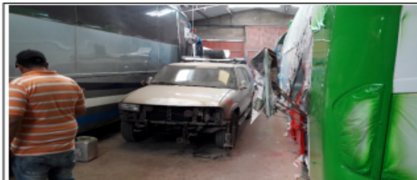
FOTOGRAFÍA 7. INTERIOR DE LA BODEGA