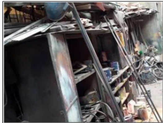
FOTOGRAFÍA 6. INTERIOR DE LA BODEGA AREA DE ALMACENAMIENTO DE PINTURAS